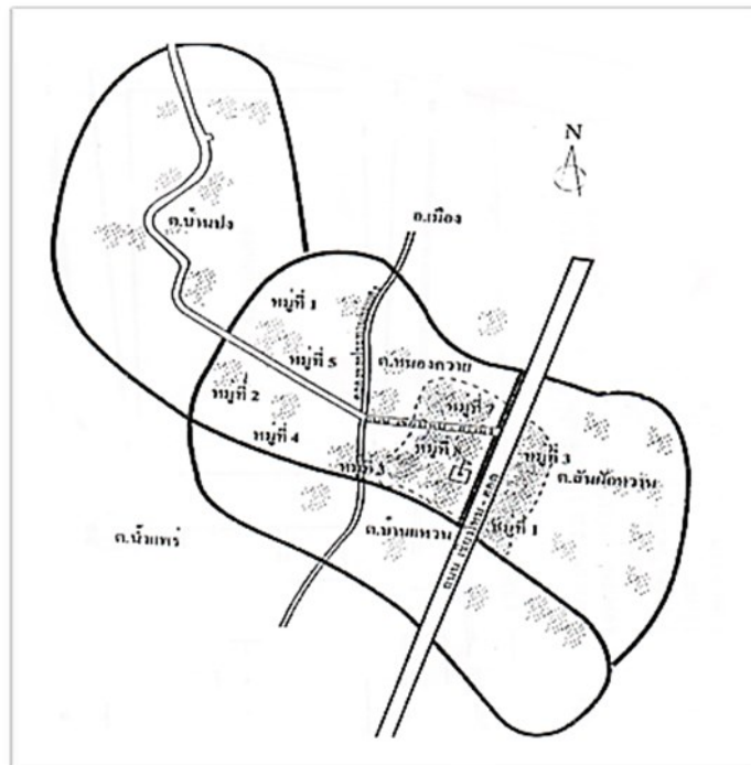
แผนที่แสดงที่ตั้งและเขตบริการของโรงเรียนบ้านสันป่าสัก

ตำบลสันผักหวาน หมู่ที่ ๑, ๒, ๓, ๔, ๕, ๖, ๗