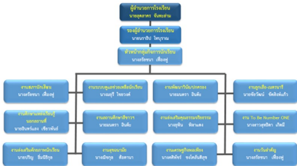
โครงสร้างการบริหารงานกลุ่มกิจการนักเรียนโรงเรียนบ้านสันป่าสัก