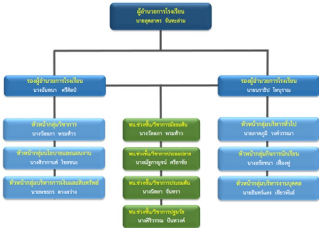
โครงสร้างการบริหารงานโรงเรียนบ้านสันป่าสัก